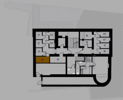
RZUT POZIOMY PIWNICY