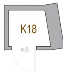
RZUT POZIOMY PRZYNALEŻNEJ KOMÓRKI LOKATORSKIEJ K18